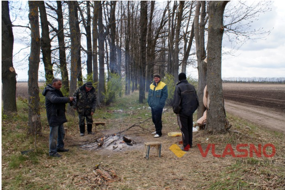
Другий блок-пост між полями

Минулого року не пустили їх і цього не пустимо — розповідають чоловіки. — Тоді все село на поле приїхало, люди стали перед тракторами і не дозволили сіяти. А за час, який їм на днів ходили чутки, що вони мають виїжджати на поля.