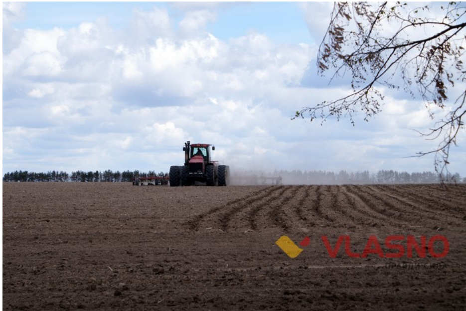
Поки селяни чергують, техніка "Правничої компанії "Справа" працює на полях